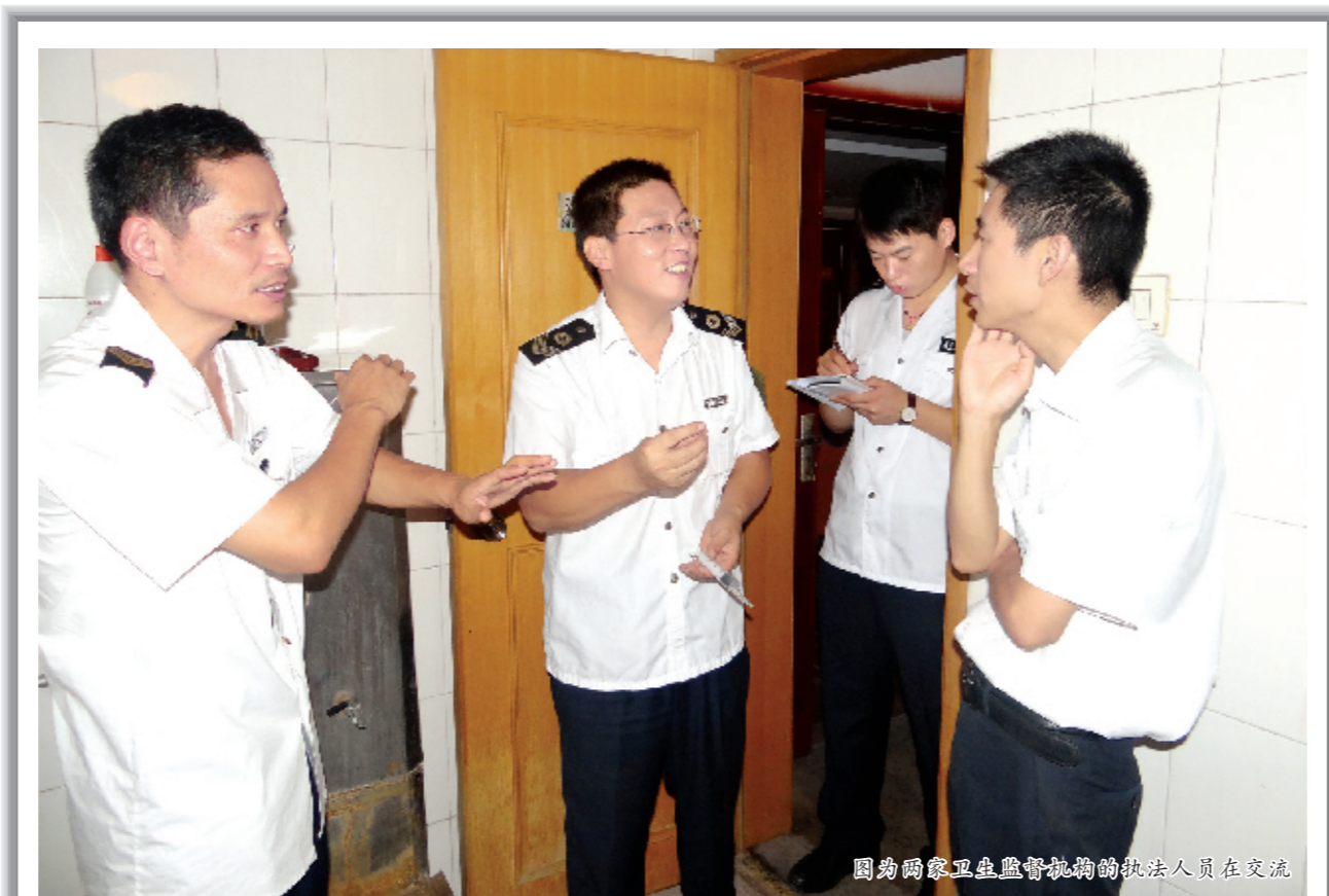
图为两家卫生监督机构的执法人员在交流

谁人愿做“含灵巨贼”?我们不能明知有害仍无动于衷。应当从自身做起,为自己穿上“防护衣”——像进行放射检查穿上铅衣那样,坚守医德。这样做,不仅仅是为了保护自己,而且也是为了保护我们的家人、同事、行业,甚至整个社会。